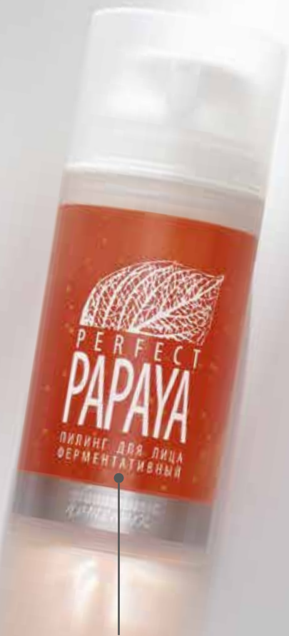
Пилинг ферментативный PERFECT PAPAYA, 100 мл

стимулирует обновление клеток разглаживает морщины освежает тусклый цвет лица