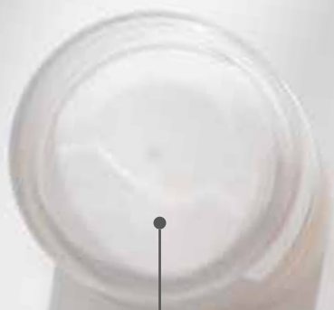
Пилинг с молочной кислотой PERFECT MILKPEEL, 100 мл

[ кислота молочная, АНА-комплекс (кислоты: гликолевая, яблочная, лимонная), протеины йогурта, натрия пирролидонкарбоксилат ]